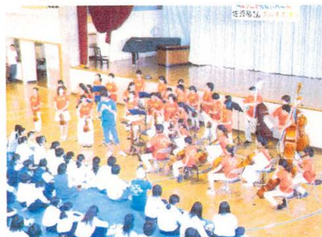
スーパキッズの皆様