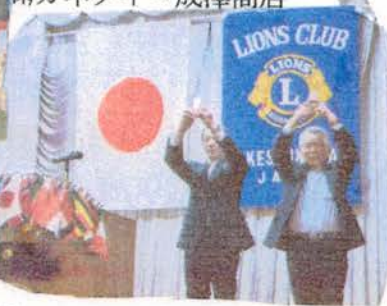
皆鶴姫の表示板除幕式