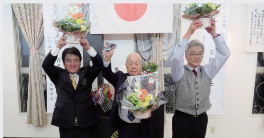
▲1月誕生日おめでとうございます