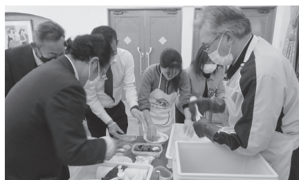
▲計画委員会とL吉野による餅の配布

今年はウサギ年で、干支は「みずのと・う」です。「みずのと・う」の年は、「寒気が緩み、新しい芽がでるのを促す年」になるそうです。今年こそ、新型コ