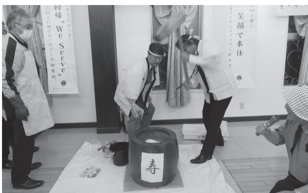
▲新年を祝って三役による餅つき

新年の幕開け、2023年1月の第一例会を気分一新、クラブメンバーの皆様とご一緒できました。昨年は、急激な円安や生活必需品の値上げ、海外情勢の変化など多数の問題があった年でした。