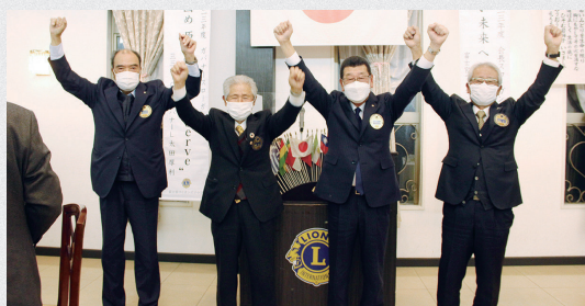
▲年男4名によるローア