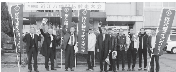
▲近江八幡LCのメンバーと応援