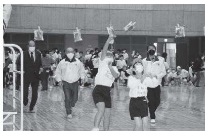
▲パン食い競争は大人気!