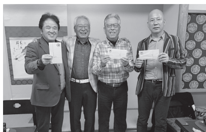
▲忘年ゴルフコンペ 成績上位3名&部長