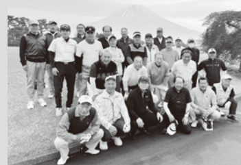
▲近江八幡LCと笑顔の親睦コンペ

プレーの合間に交わされた冗談や拍手が、距離以上に心の距離を縮めてくれた楽しい交流だったと思います。今後もゴルフ部の活動に多くのメンバーの参加をお待ちしております。