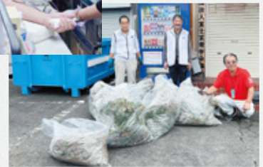
▲事務局もたくさん草が取れました