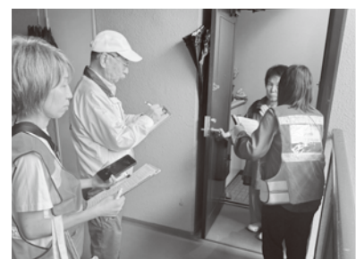
▲訓練と思えぬ真剣な表情

4件の家に聞き取りに行き、聞き取ったニーズを本部へ送信し、キントーン入力。プリントアウトし、マッチング班へ提供する訓練を行いました。日赤の方が炊き出し訓練を実施しビニール袋でご飯を炊きました。車で聞き取り調査に行きましたが、災害時、交通障害、ライフラインの停止した時、訓練の様にスムーズに出来るか考えさせられました。