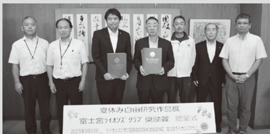
▲よい研究ができますように

小中学生の研究に更に力が入る事を願っています。青少年委員会の皆さんありがとうございました。