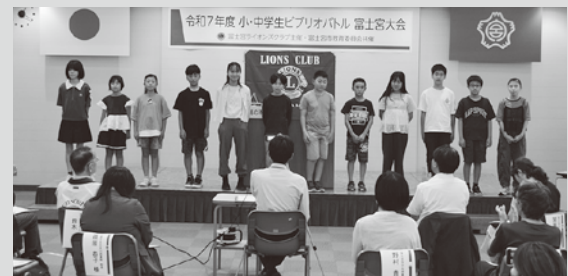
▲小学生の代表勢揃い