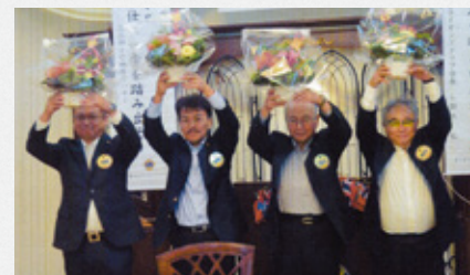
▲誕生日おめでとう