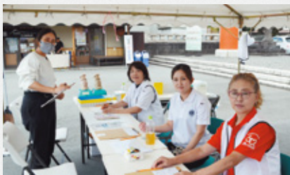
▲女性陣献血受け付け御苦勞様です