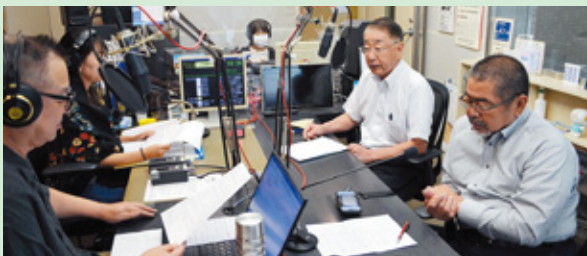
▲ライオンズデー実行委員長 PR 張り切ってます

9月29日曇り空の本日リスナーの皆様いかがお過ごしでしょうか？時刻は10時10分になります。