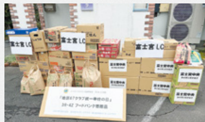
▲高くなったお米もたくさん