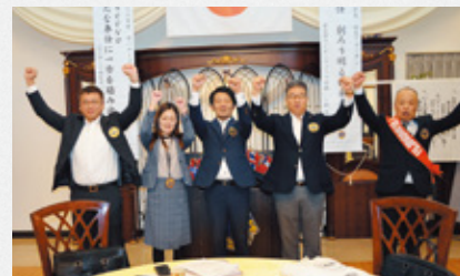
▲青少年委員会のローア