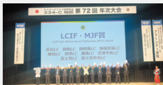
▲昨年度に引き続き受賞となりました