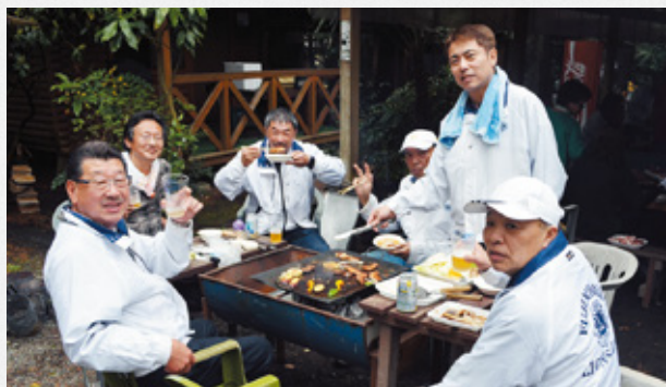
▲計画委員会お疲れ様です