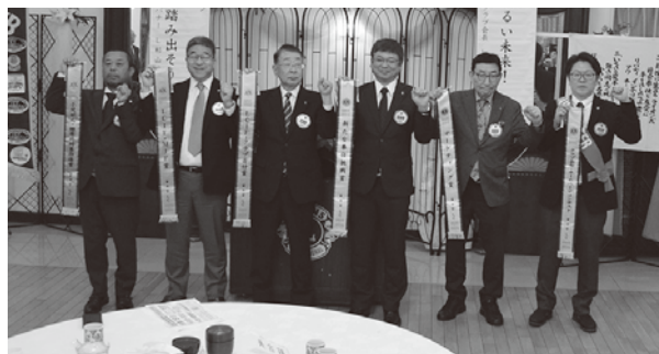
▲アワード6部門受賞