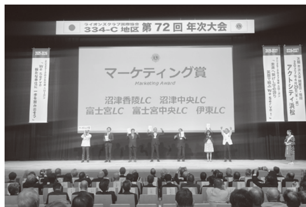
▲MC 報告書に書く事多数の結果