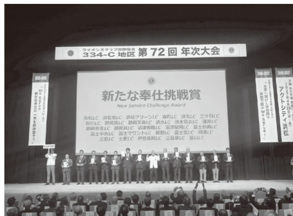
▲IAI、夏休み自由研究の新しい取組み