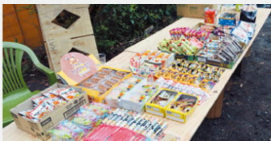
▲子ども達も大喜び 景品の数々