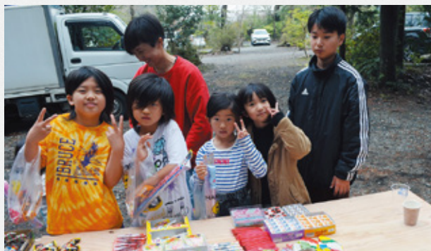
▲昔なつかしい駄菓子が景品