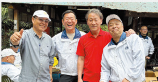
▲次年度会長以下役員の皆さん