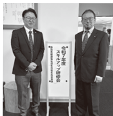
▲気合を入れて臨む二人

麻薬取締官とは厚生労働省管轄の国家公務員で薬物犯罪捜査に関しては警察よりも強い権限を有している事と、最近の薬物情勢として、不正薬物の押収量が2年連続2トンを超え、摘発件数も過去最高を記録している。加工物も増加中で電子タバコ用リキッド・クッキー・グミ・チョコなどがあり外観では識別が困難なものが存在している。近年では県内でも10代・20代が増加中で