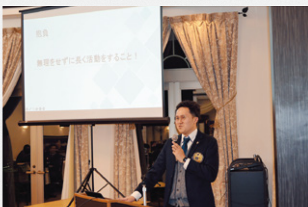
▲L矢川 入会抱負と社労士としてのスピーチ