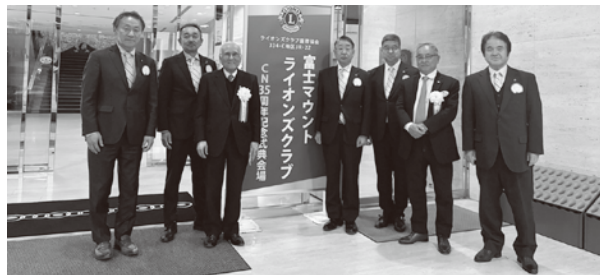
▲富士グランドホテルにて 114名参加

と協働して毎年8校程で行ってきていること、中学生の全国大会出場優秀選手に対する表彰を毎年行っていることが発表され、最後に35周年記念事業としてこども食堂の支援を行ったことが発表されました。以前岳南ライオンズクラブでも助産師さんとの協働事業のことを聞き、富士のクラブにおいては助産師さんとの繋がりが強いのだと感じました。式典終了後は第二部の懇親会に移り、賑やかな時間を過ごしている内に終了しました。