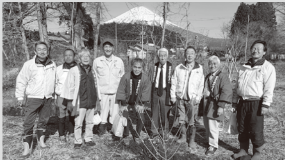
▲「十郎梅」5本を植樹 数年後が楽しみ！

3月5日（木）13:30分より、「白糸の滝」景観保全エリア植樹祭が曾我の隠れ岩南側にて行われ会長をはじめ3名で参加しました。